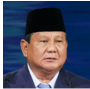
普拉博沃·苏比延多 印度尼西亚共和国总统