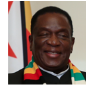
埃默森·姆南加古瓦 津巴布韦总统