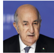
阿卜杜勒 - 马吉德·特本 阿尔及利亚民主人民共和国总统