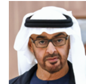
穆罕默德·本·扎耶德·阿勒纳哈扬 阿拉伯联合酋长国总统

“今天的俄罗斯有着丰富而雄心勃勃的经济议程。我们面临的困难和问题激励着我们加快转型的步伐，提高转型的质量，在提高公民的生活质量、福利和福祉方面取得更大的成就。毫无疑问，我们将在所有领域加强我们的主权，当然，在这项工作中，我们愿意与所有像俄罗斯一样重视其国家利益并准备决定自己未来的国家建立平等的伙伴关系。”