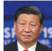
习近平 中华人民共和国主席