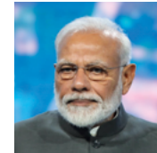
纳伦德拉·莫迪 印度共和国总理