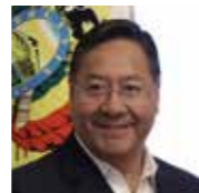
LUIS ALBERTO ARCE CATAORA Presidente de Bolivia