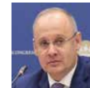
ANTÓN KOBIAKÓV Asesor del Presidente de la Federación de Rusia, Secretario Ejecutivo del Comité Organizador del SPIEF

«Rusia y la India tienen una relación de confianza. Las raíces de nuestras relaciones se remontan a la historia, y en todas las cuestiones del ámbito internacional, la India y Rusia siempre se han mantenido juntas y han avanzado juntas paso a paso, no solo en nuestras relaciones bilaterales, sino también en nuestros contactos sobre cuestiones internacionales, trabajando en beneficio del mundo entero».