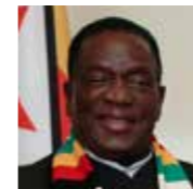
EMMERSON DAMBUDZO MNANGAGWA Presidente de Zimbabwe