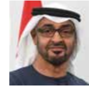
MOHAMMED BIN ZAYED AL NAHYAN

Presidente de la República Argelina Democrática y Popular