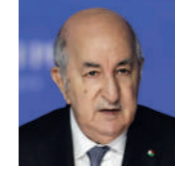
عبد المجيد تبون رئيس الجمهورية الجزائرية الديمقراطية الشعبية