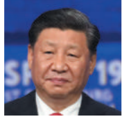
شي جين بينغ رئيس جمهورية الصين الشعبية