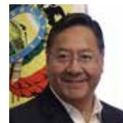
ЛУИС АЛЬБЕРТО АРСЕ КАТАКОР Президент Боливии

«У Индии и России доверительные отношения. Корни наших отношений уходят в историю, и по всем вопросам на международной арене Индия и Россия всегда стояли вместе и вместе шли вперед шаг за шагом не только в наших двусторонних отношениях, но и в наших контактах по международным вопросам, работе на благо всего мира».