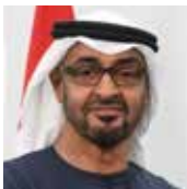
АЛЬ НАХАЙЯН, МУХАММЕД БЕН ЗАИД

Президент Объединённых Арабских Эмиратов