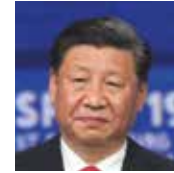
XI JINPING Presidente de la República Popular China

«Se han tendido puentes de colaboración entre Rusia y los Emiratos Árabes Unidos y estamos trabajando activamente. Construimos relaciones sólidas y duraderas. Gracias por brindar a las empresas emiratíes la oportunidad de hablar en este foro. Este foro tiene un papel muy importante este año. Creo que la cooperación del sector privado —entre los sectores privados de los dos países— juega un papel importante en el desarrollo de nuestras relaciones bilaterales. Por ejemplo, el turismo bilateral se está desarrollando con mucha fuerza: este año esperamos recibir un millón de turistas rusos. Esta es una etapa muy importante y un momento importante en el desarrollo de nuestras relaciones».