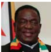
EMMERSON DAMBUDZO MNANGAGWA