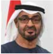
MOHAMMED BIN ZAYED AL NAHYAN Presidente de los Emiratos Árabes Unidos