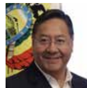
LUIS ALBERTO ARCE CATACORA Presidente de Bolivia