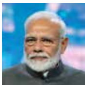
NARENDRA MODI Primer ministro de la India